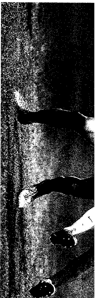
Předehrávka 21. kola fotbalové ligy