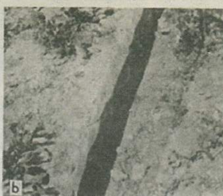
118. a) Pluh k hloubení příkopů proti nosatcům, b) příkopek vyhloubený proti nosatcům.