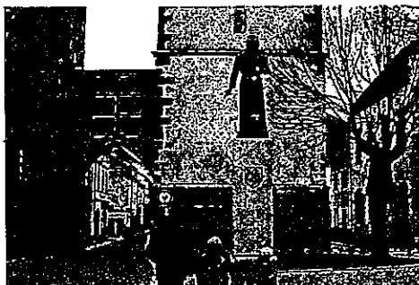
PRAŽSKOU BRÁNU, před níž stojí nedávno odhalená socha Přemysla Otakara II., by měla opět zdobit Alšova sgrafita.

Vysoké Mýto – Ze stavebních akcí prováděných v letošním roce se stane určitě zajímavostí oprava sgrafit na Pražské bráně. Výběrové řízení na jejich obnovu již schválila rada města, stejně jako zařazení do „Programu regenerace městských památkových rezervací a městských památkových zón“ pro letošní rok. Náklady jsou propočítány na sumu 1,16 milionu korun (bez DPH), město se však netají nadějí, že částka jako výsledek soutěže bude o něco nižší. Dotace z celostátního „programu“ by mohla dosáhnout čtyř set tisíc korun, což by vedení města přivítalo, zbytek uvažovaných nákladů by uhradilo ze svého rozpočtu.