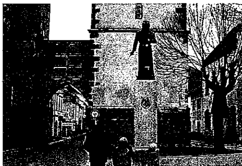
PRAŽSKOU BRÁNU, před níž stojí nedávno odhalená socha Přemysla Otakara II., by měla opět zdobit Alšova sgrafita.

Vysoké Mýto - Ze stavebních akcí prováděných v letošním roce se stane určitě zajímavostí oprava sgrafit na Pražské bráně. Výběrové řízení na jejich obnovu již schválila rada města, stejně jako zařazení do „Programu regenerace městských památkových rezervací a městských památkových zón“ pro letošní rok. Náklady jsou propočítány na sumu 1,16 milionu korun (bez DPH), město se však netají nadějí, že částka jako výsledek soutěže bude o něco nižší. Dotace z celostátního „programu“ by mohla dosáhnout čtyř set tisíc korun, což by vedení města přivítalo, zbytek uvážovaných nákladů by uhradilo ze svého rozpočtu.