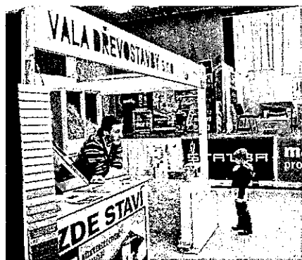
STAVÍME, BYDLÍME. Stavební výstava Stavíme, bydlíme si v Třebíči získala zájem návštěvníků.

Namátkou uvedu například koupelnové studio, které patří k nejmodernějším a největším specializovaným prodejnám na Vysočině. Toto studio nás přivádí nejen nové koupelny, ale důležitý chybějící dílek do skládáčky nového bydlení – interiérové truhlářské práce. Návštěvníkům bude nabídnut kompletní balíček služeb v oboru dveří, oken a kování,