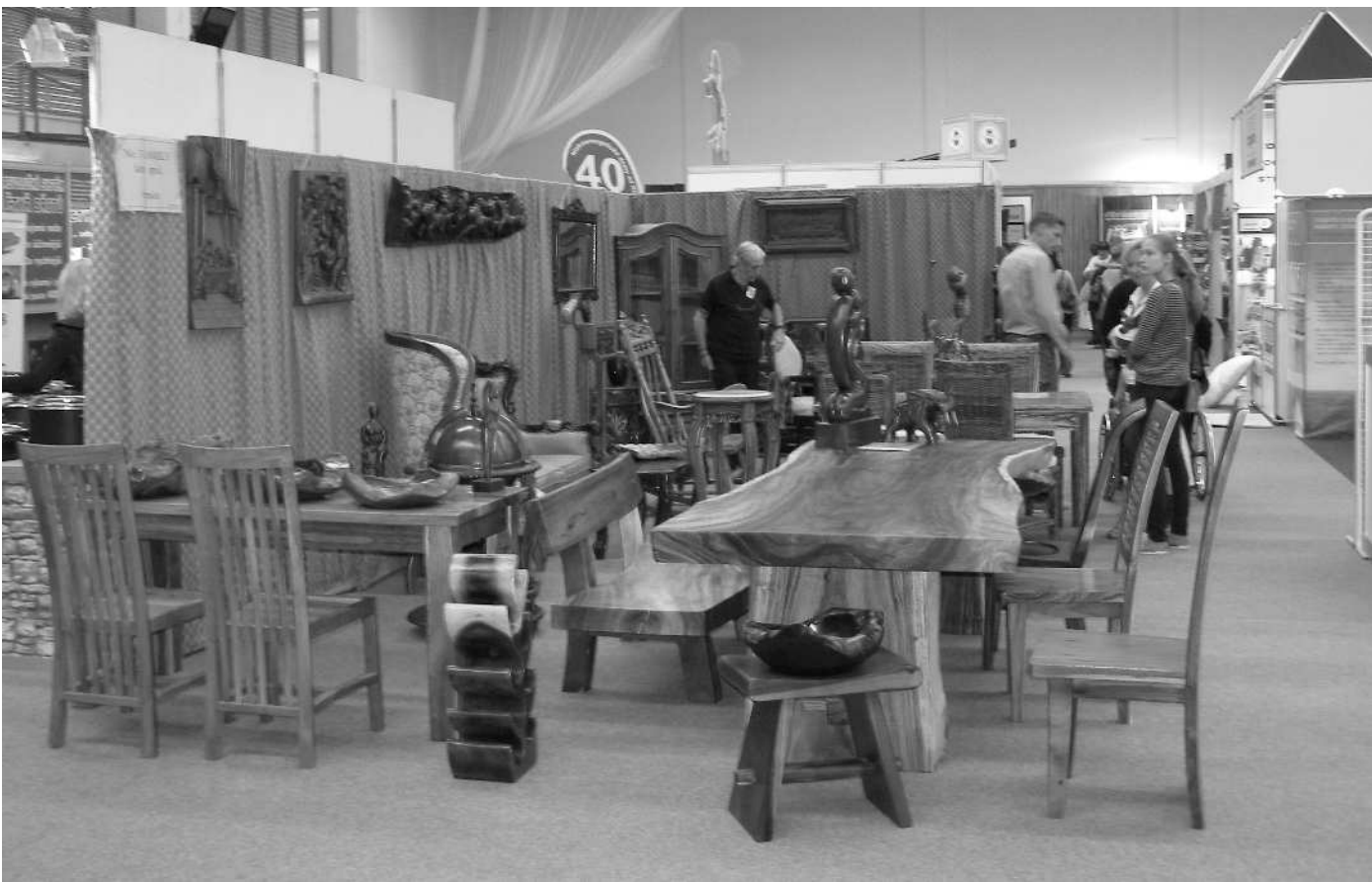
INSPIRACE. Mezi expozicemi v hale v Plzni na Slovanech najde od pátku do neděle inspiraci každý, kdo se chystá rekonstruovat stávající bydlení nebo stavět nový dům.

Venkovní plochy se ponesou ve znamení vytápění. Najdete zde kanadská kamna, litinové kotle, solární kolektory, tepelná čerpadla, horkovzdušná kamna na pelety, ale také infračervené topné panely. Zajímavá bude expozice se sudovou saunou ze smrkového dřeva, kterou lze umístit kamkoliv bez velkých stavebních úprav. Zahrádkáře zaujme mototúčko pro lehkou