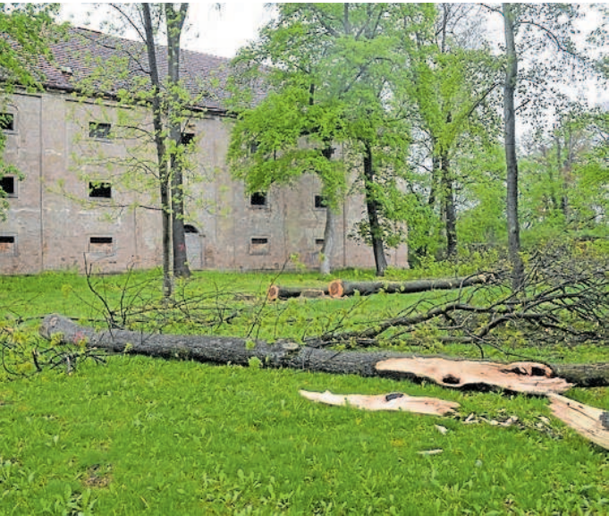
ZÁMECKÝ PARK je kvůli kůrovcové kalamitě uzavřen.