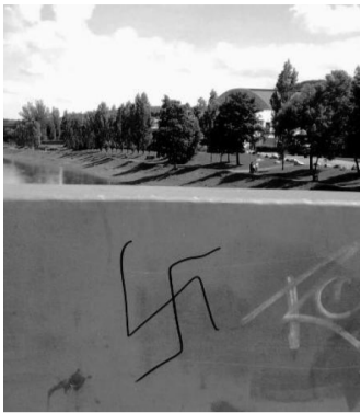
HÁKOVÉ kříže se objevovaly hlavně v centru města.

Skupina kriminalistů, která byla pro tento účel vyčleněna, využila operativně pátracích prostředků k tomu, aby pachatele odhalila. „Na konci minulého týdne se podařilo