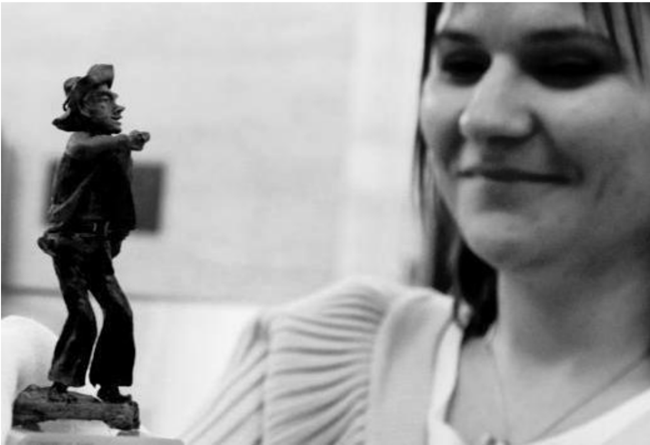
KOLEKCI DOKUMENTŮ A PŘEDMĚTŮ Muzea Dělnického hnutí získalo do svých sbírek Národní muzeum v Praze. Sbírka mapuje české a československé politické, sociální i kulturní dějiny od poloviny 19. do konce 20.století. Na snímku chlebová figurka Tuláka, vytvořená někdejším československým prezidentem a zákolanským rodákem Antonínem Zápotockým ve vězení, pravděpodobně v roce 1921.