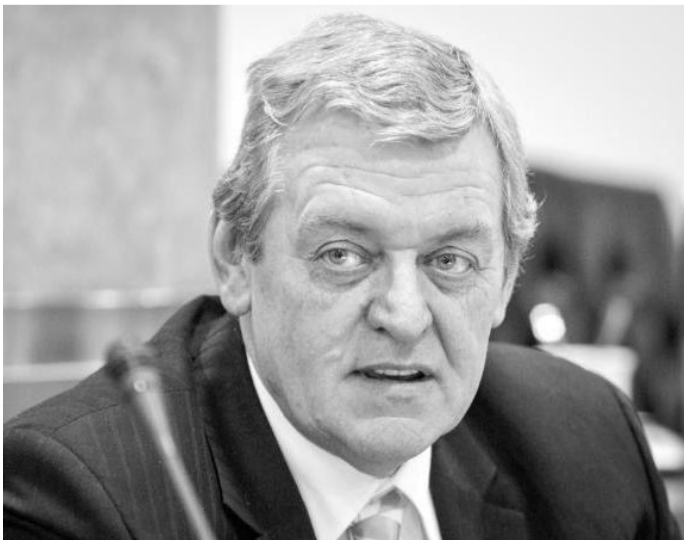
ZDENĚK SYBLÍK (na snímku z jednání krajského zastupitelstva) složil poslanecký slib při úterní mimořádné schůzi Poslanecké sněmovny Parlamentu České republiky.

Zdeněk Syblík se narodil 7. května 1956. Vystudoval Střední průmyslovou školu strojní v Kladně, posléze Vysokou školu pedagogickou v Hradci Králové. V letech 1980